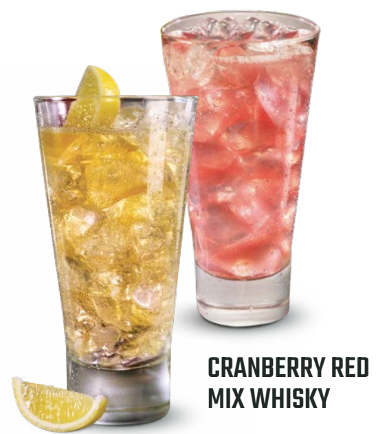
CRANBERRY RED MIX WHISKY

Whisky Johnnie Walker Red Label®, jugo de cranberry y ginger ale.