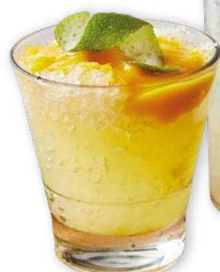
MANGO LEMONADE SHAKER

Vodka Smirnoff®, puré de mango, ron de coco, agave, jugo de lima y limón.