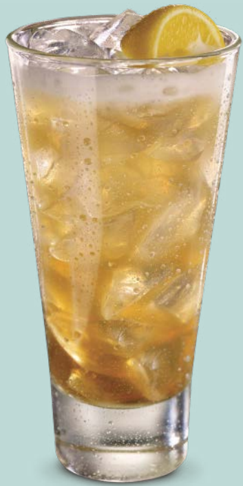
ULTIMATE LONG ISLAND ICED TEA

Vodka Smirnoff®, Tanqueray London Dry Gin®, Ron Cartavio®, triple sec, jugo de cranberry, lima y limón.