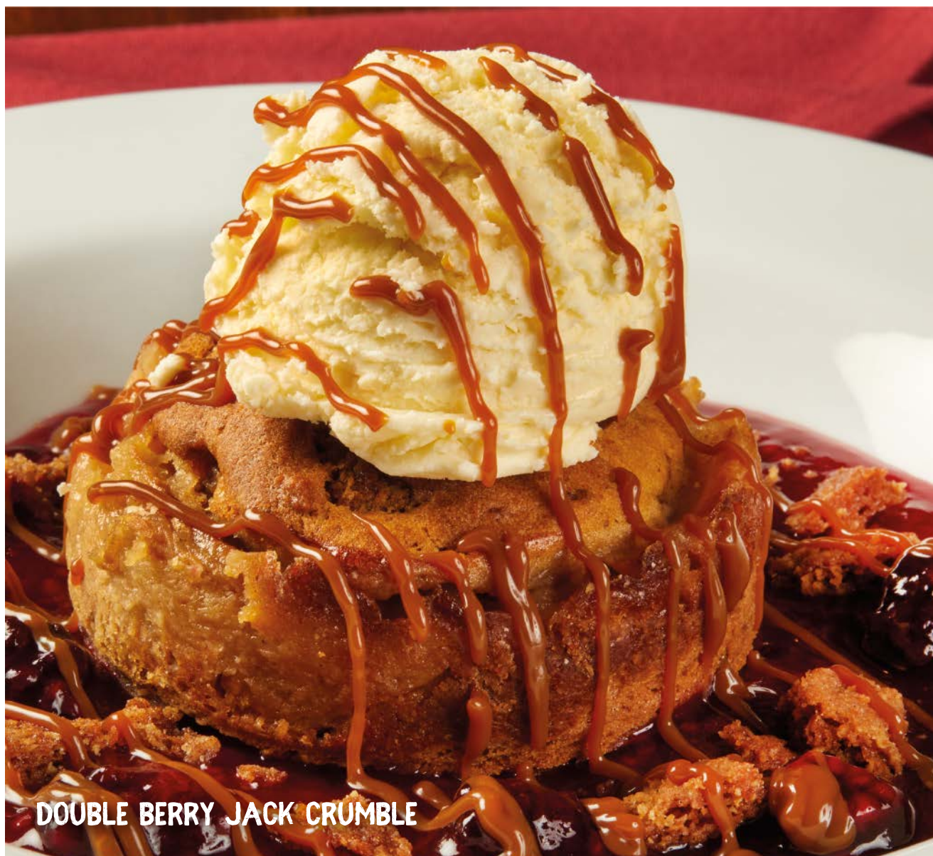
DOUBLE BERRY JACK CRUMBLE

Deliciosa tarta de manzana sobre una base de compota de manzanas horneadas, granola de canela y caramel sauce. Lo servimos con helado.