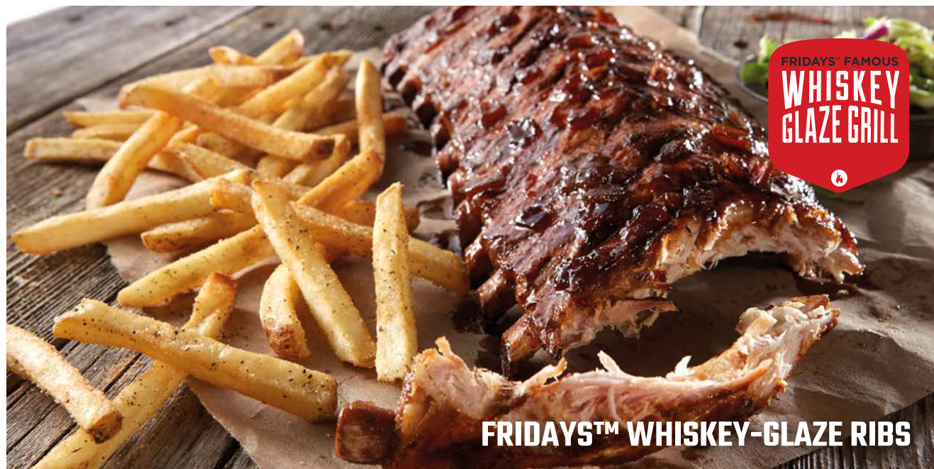
FRIDAYS™ WHISKEY-GLAZE RIBS