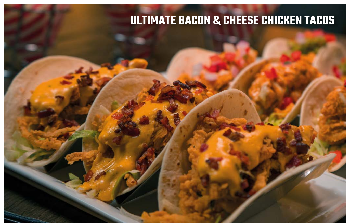
ULTIMATE BACON & CHEESE CHICKEN TACOS