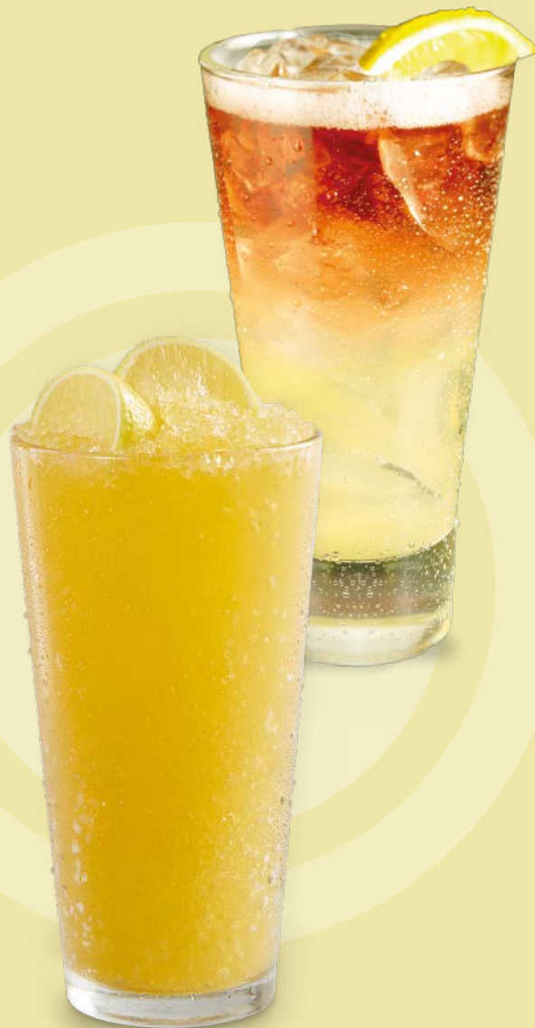
MANGO PEACH LEMONADE SLUSH

NEW BLUE RASPBERRY S/ 15.00 Blue raspberry, limonada y Sprite®.