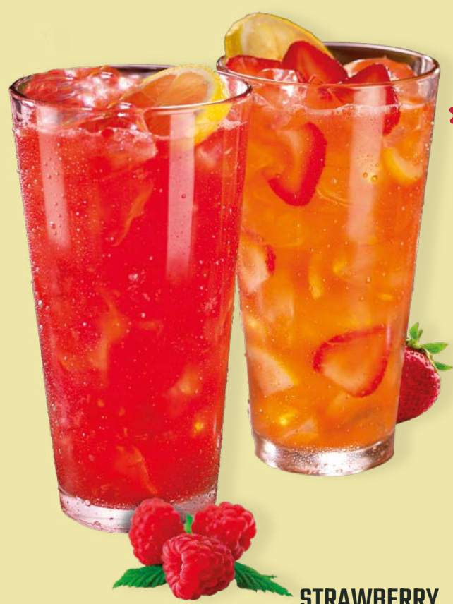
STRAWBERRY PASSION TEA