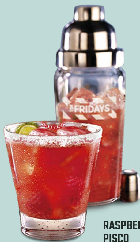
RASPBERRY PISCO SHAKER

Pisco Tabernero®, jarabe de frambuesas, guayaba, jugo de piña y Ginger Ale Schweppes®.