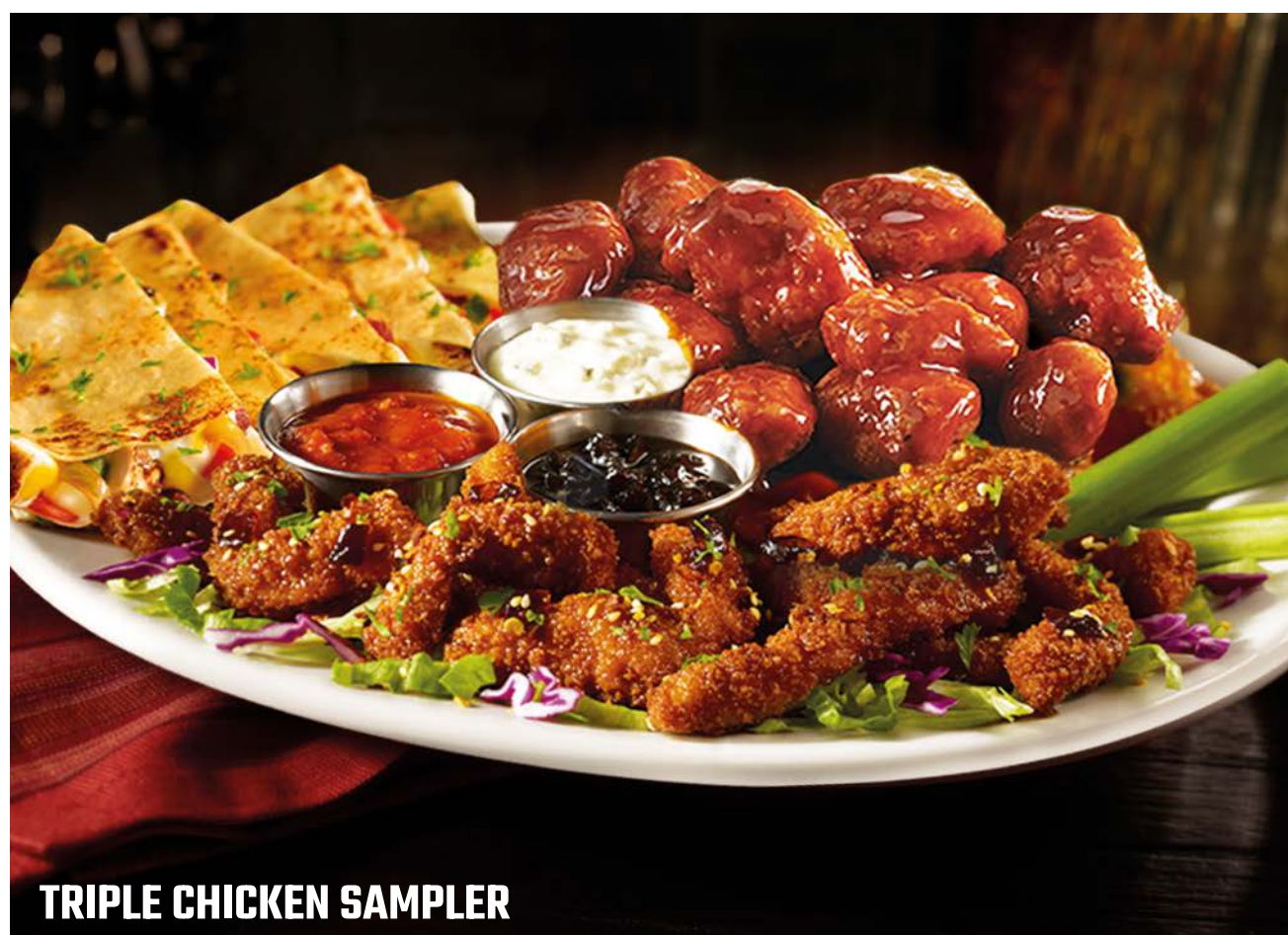
TRIPLE CHICKEN SAMPLER