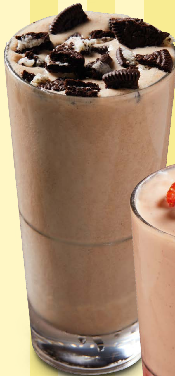
COOKIES AND CREAM