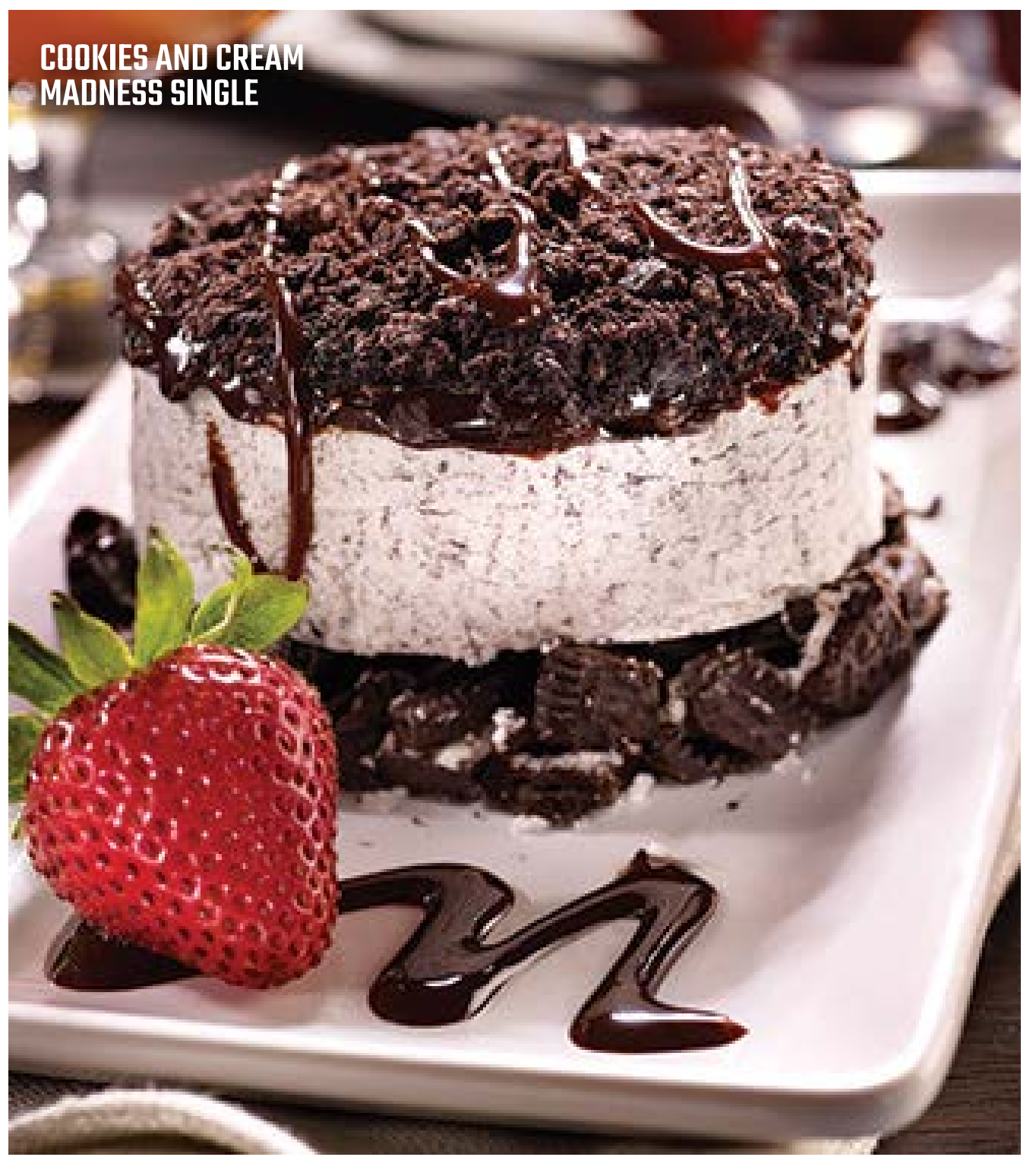
COOKIES AND CREAM MADNESS SINGLE