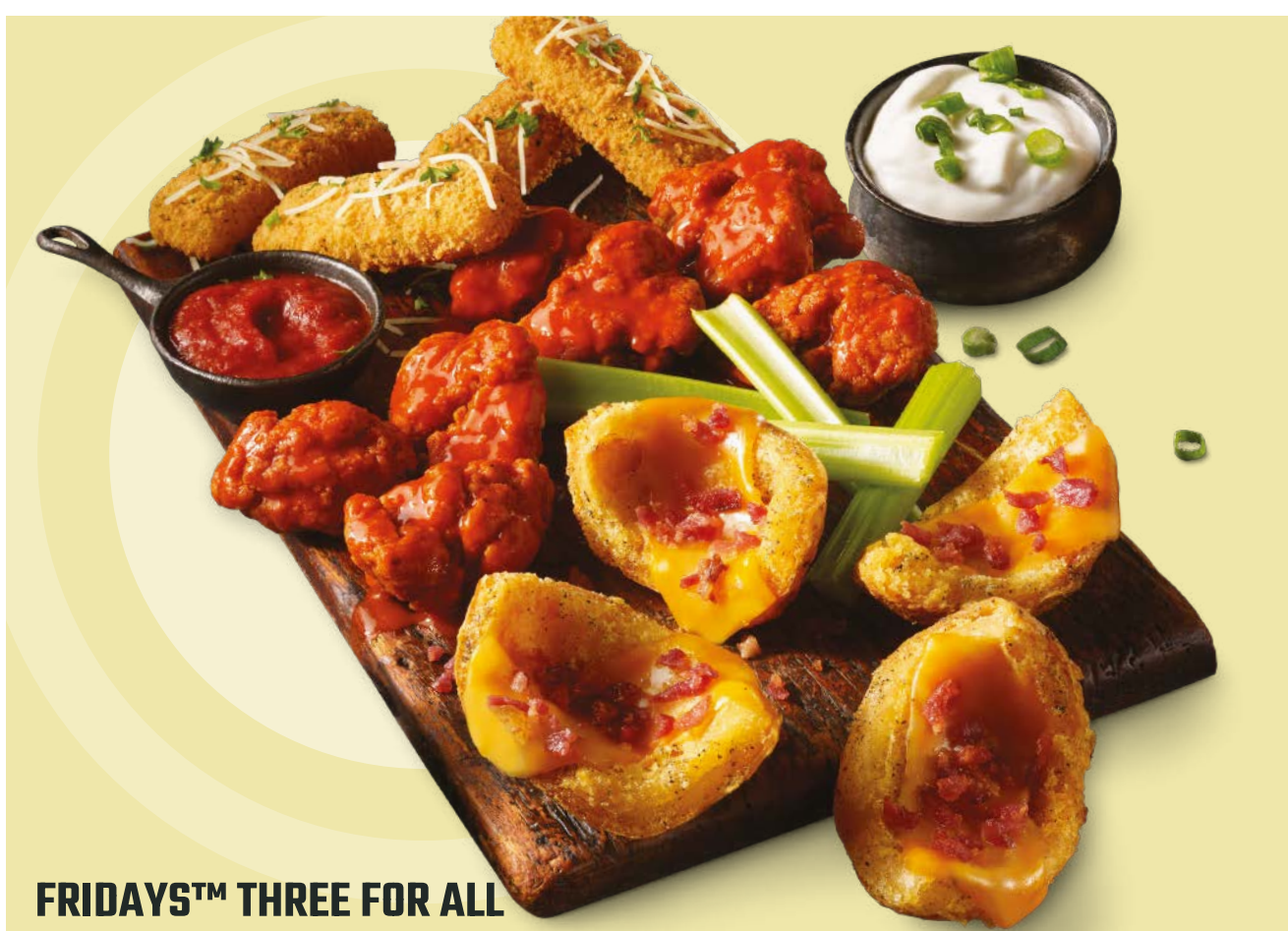
FRIDAYS™ THREE FOR ALL

Tres clásicos piqueos Fridays™ diseñados para compartir: Loaded Potato Skins, Fried Mozzarella y Buffalo Wings. También puedes probarlo reemplazando tus Buffalo Wings por unos deliciosos Boneless Buffalo Bites.